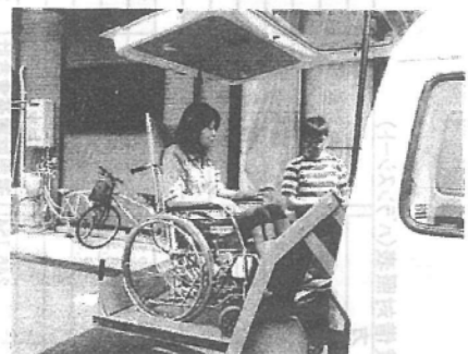
おおお... (おっかなびっくり) by角田