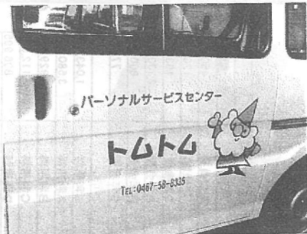
ロゴと可愛いトムじい

皆様のお陰をもちまして、総額122万円のカンパ金が集まりました。本当にありがとうございます。全額トムトムの新車両購入の費用とさせていただきます。