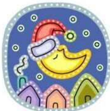
ちゅうじょうたかゆき 中條 高行