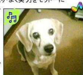
愛犬のナウちゃん♀15オビール犬です

で飛びこんだ世界でしたが、幸運にもたくさんの方との出会いに恵まれ、貴重な経験を積む事が出来た事に感謝の気持ちと出会いの大切さを感じています。この度 縁があつて、トムトムの一員となりました。そして「トムトム」がアイヌ語で「キラキラ光る」という意味だと初めて知りました。たくさんの方の想いや希望があふれているステキな言葉だと思います。法人設立から10年の節目の年に職員として関わることできる事に新人として喜びを感じると共に、ご利用者、ご家族が「キラキラ光る」ための支援につながるよう、お手伝いできればという思いでいっぱいです。トムトムはご利用者のお子さんたちはもちろん、職員も若い人が多く、パワフルです。何とか皆さんについていけるよう「よく食べ・よく眠り・よく笑う」をモットーに体力をつけ、「がんばらない」けど「へこたれない」ようにしたいです。2ヶ月余り経過しましたが、制度の事、業務の内容等まだまだわからない事がたくさんあります。皆さんに教えていただきながら日々努力をしたいとおもっています。どうぞよろしくお願い致します。出勤時、銀河大橋から見える雪化粧した富士・箱根・丹沢の山々がすばらしくいつみても感動します。そんな気持ちを忘れないように、そして新しい出会いを大切にトムトムと一緒に歩んでいければと思っています。