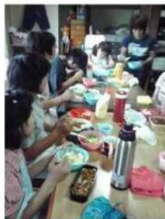
カレーパーティー