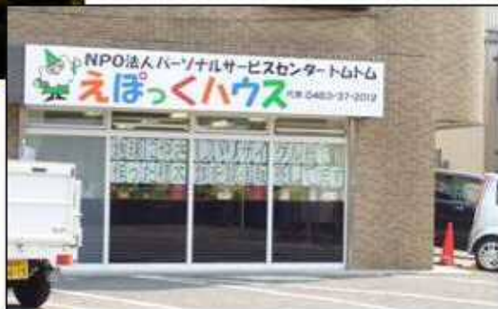
屋敷 2010年(平成22年)5月27日 木曜日