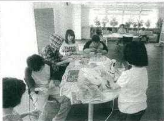
日中、エコポット作りに取り組み障害者たち 平塚市南原の「えぼっくハウス」

特別支援学校を卒業した。出た。4月に平塚市南原に新設された「えぼっくハウス」を開設し、若者たちが各自に向けた第一歩を踏み出している。 トトムには、障害児の一時預かり受入れが十分にない。平塚市が1999年に発足したNPOとして10年を営んだ。現在、茅ヶ崎と平塚の両市に計5カ所の施設を運営している。 特別支援学校の生徒が放課後を過ごすための支援策を平塚市が完全に完結して実施していることを受けて、トトムでは5年前から施設で障害児の福祉を子どもたちのケアを担ってきた。しかし、卒業後はそれぞれ就職していき、希望する施設に入れないまま、新たな環境にならなければならない。本人が充実した日々を送れないのが現状だ。