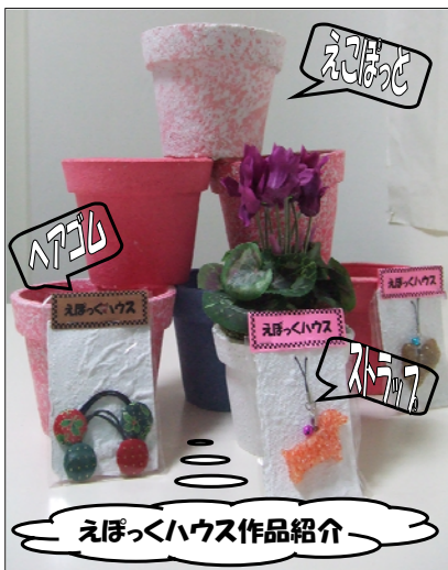
えぼっくハウス作品介绍