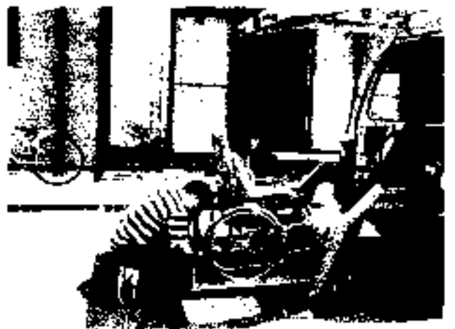
ベルトをきちっと締めてと...