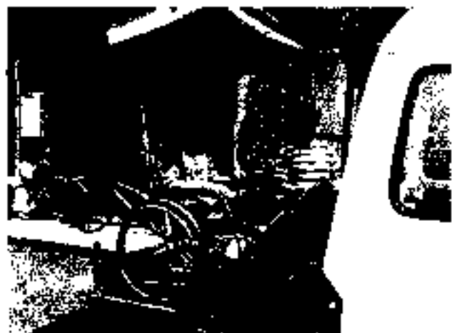
おおお... (おっかなびっくり) by角田