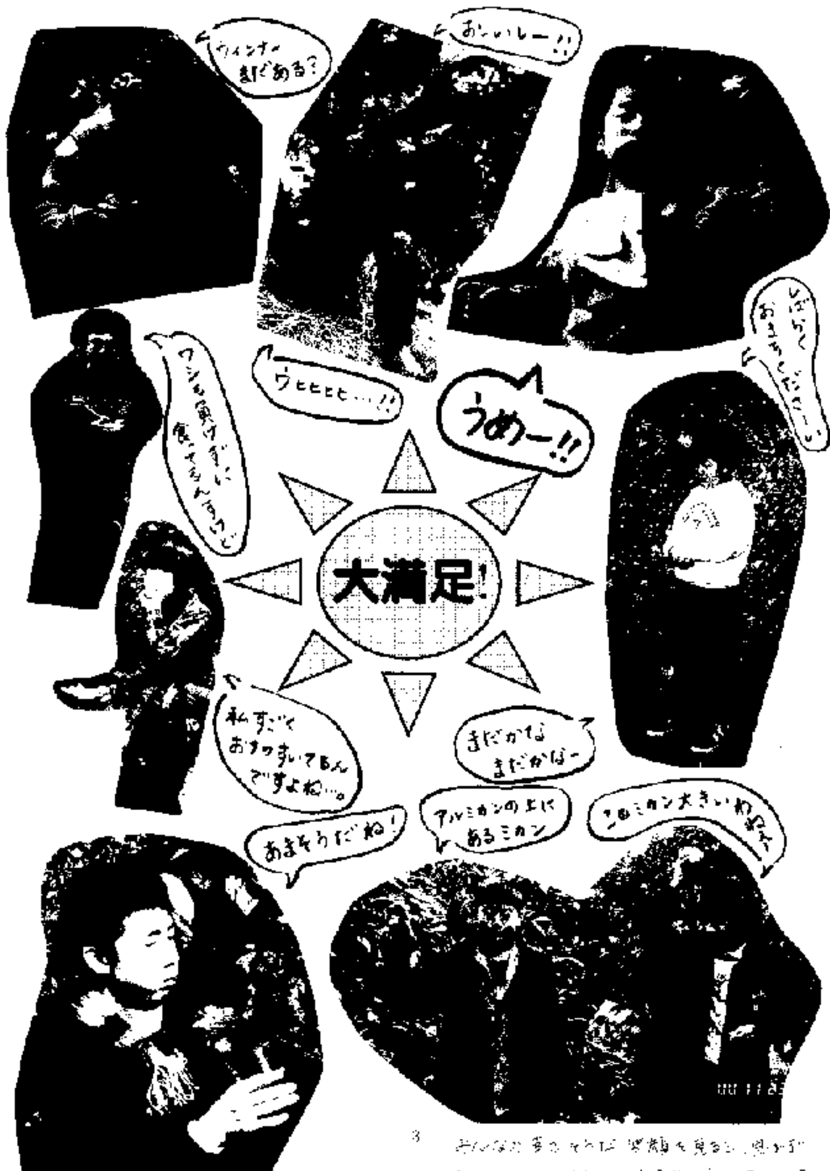
3 おいおい 夢のアメリカ 惣菜店を見る。思ふに 3000円を1000円に引き下げる。おまけ。