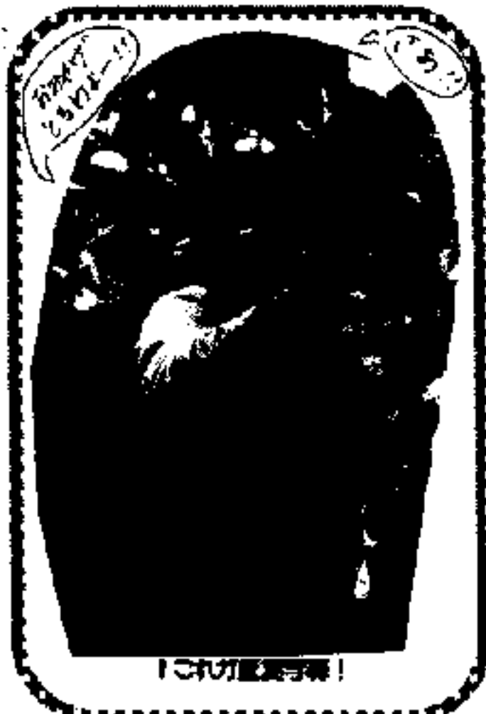
「これかみかん狩り！」

天気予報は曇り、寒い一日ということでした。参加したみんなは、全員しっかり防寒の様子で安心して出かけました。祭日でしたが道が思ったよりスムーズで、予定通りにみかん園に到着。ウズウズしていた彼等は、木々になっているたくさんのみかんに、ハサミと網の袋をもらうと、木の下へてんでんばらばらにかけこむ。動いてどこかへ行ってしまおうわけもないのに、なんだかあせって取ってしまう。同じ畑にあった青いハッサクを取って食べ始めた彼。スッパイよー。でも本人はこの味が気に入ったようで、最後にもう取って食べていました。車いすの彼女だって興じて使せん。「あれーこれー」と言いながらもぎり取って楽しんでいました。各々の楽しみ方味わい方で一時をすごし、ふと網袋を見ると、テーブルに1～2個入れて放ってあります。だって誰もお土産だなんて思っていないのですから、もいだり、食べだりで十分満足なのです。私は「それでは」と木に登り（アレ！いけなかったかな）上の方の日に輝く大きめのみかんを取ってみんなの袋に入れようがんばったのですが、ちゃんと大きなみかんは入っていたでしょうか。